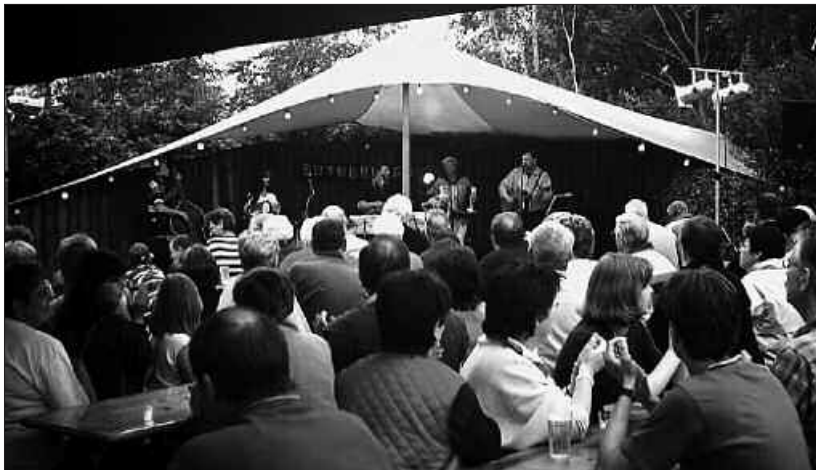
Livemusik auf der Sommerbühne Kalifornien.

oder 15 Jahren in Schönberg aufgetreten sind, aber damals noch nicht prominent waren. Viele vergessen das nicht und kommen wieder zu Bedingungen, die für uns machbar sind.