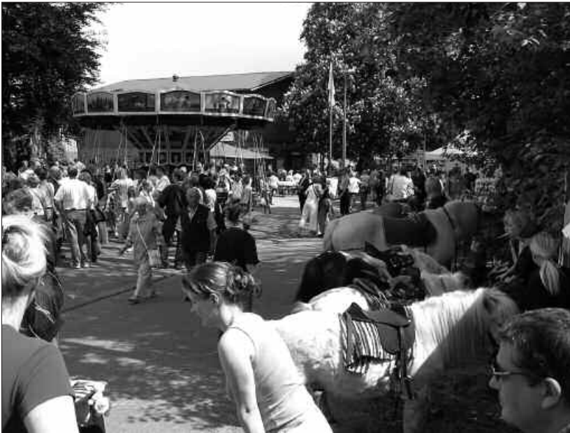
Naturparkfest im Aukrug am 21.05.2006