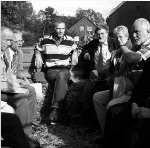
Die Bewertungskommission für den Landeswettbewerb „Unser Dorf hat Zukunft“ unterwegs zur Begutachtung.

Schleswig-Holstein e. V. vertrat. Des weiteren waren Vertreter und Vertreterinnen des Gemeindetages, des Schleswig-Holsteinischen Heimatbundes, der Landjugend, der Landfrauen und des Landesnaturschutzverbandes sowie der Staatskanzlei, des Landwirtschaftsministeriums und der Landwirtschaftskammer in der Kommission vertreten.