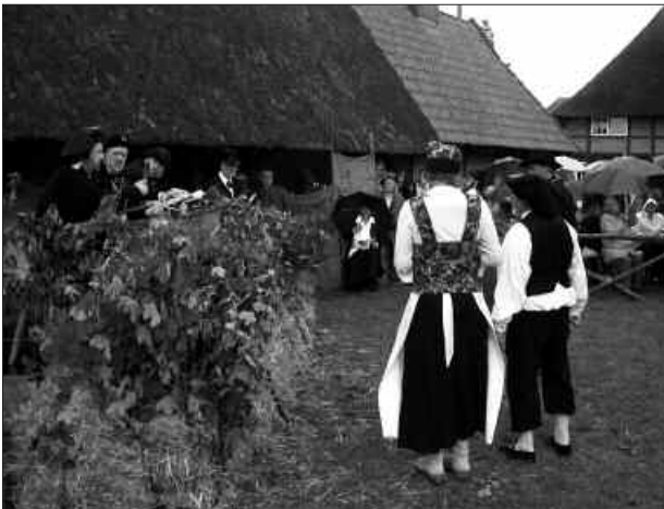
Theater- Aufführung zum Thing-Tag am Probstei-Museum.

Das Kindheitsmuseum ist im alten Schönberger Amtsgericht untergebracht. Alle drei Museen werden von gemeinnützigen Vereinen betreut, die Gemeinde stellt die Gebäude kostenlos zur Verfügung und unterhält sie.