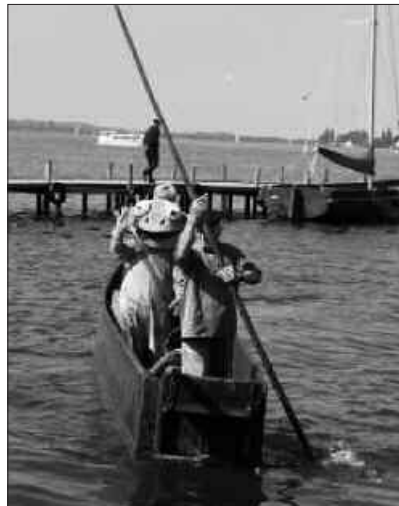
Max Moofrosch beim Beginn seiner Reise am Steinhuder Meer