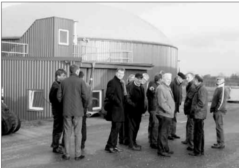
Ein Gruppe der Veranstaltungsteilnehmer vor der Biogasanlage Dörpum

unter Verwendung des Artikels „Biogas: Viele Fragezeichen“, shz-Verlag vom 4.12.2009