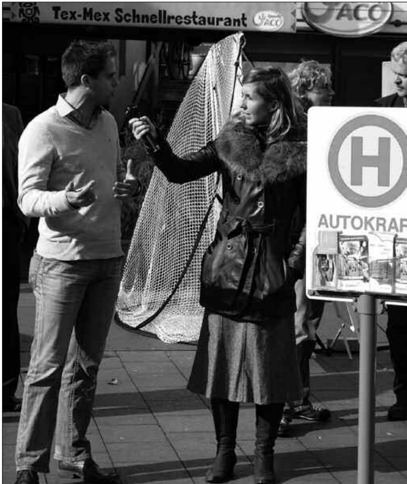
...bis zum Anrufbus in der LAG AktivRegion Wagrien-Fehmarn“

Sorge, Südliches Nordfriesland, Schwentine-Holsteinische Schweiz, sowie Eider- und Kanalregion Rendsburg über ihre aktuelle Arbeit und Projekte. Die mitgebrachten Themen und Projekte spiegelten die große thematische Bandbreite der