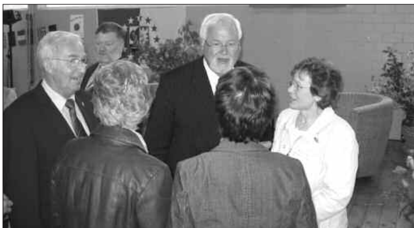
Bürgergespräch mit dem Ministerpräsidenten am 22.4.2009 in Linden. Gastgeber waren die Europagemeinde Linden und der Landfrauenverein Hennstedt und Umgebung.