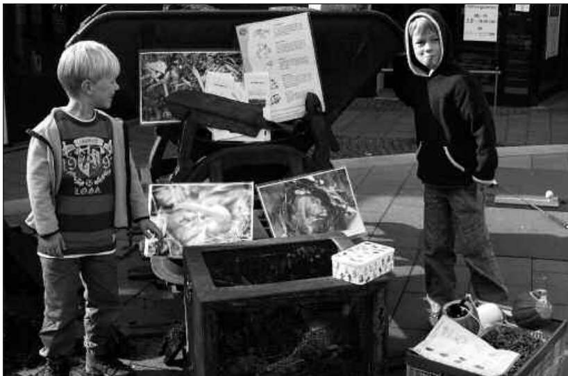
Die Vielfalt der Themen war beeindruckend und reichte von der Haselmaus in der LAG AktivRegion Mittelholstein...

vor, die die ländliche Entwicklung im nördlichsten Bundesland vorantreiben: das Ministerium für Landwirtschaft, Umwelt und ländliche Räume, die Akademie für die Ländlichen Räume Schleswig-Holsteins e. V., mehrere der 21 AktivRegionen und das landesweite Projekt MarktTreff. Den kulinarischen Part der starken schleswig-holsteinischen regionalen Netzwerke übernahm mit zehn Zeltständen der FEINHELMISCH e. V., der Leckereien mit frischen Produkten aus den AktivRegionen bot – von Salzauer Shiitake-