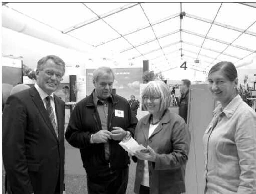
Die Europaabgeordneten Schleswig-Holsteins, Reimer Böge (1. v.l.) und Ulrike Rodust (3. v.l.) standen am Europa-Stand auf der Messe NORLA in Rendsburg Bürgerinnen und Bürgern zum Gespräch zur Verfügung.